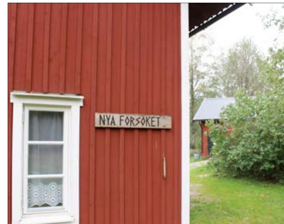
Vid "Nya försöket" uppe på Bredfjället samlades ungdomar från hela världen.