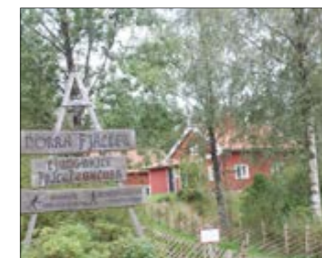
Tävlingen startar på Norra fjället.