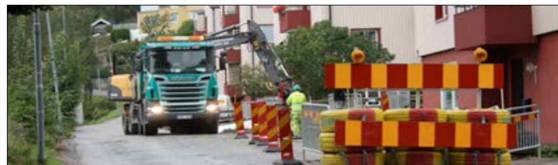
Arbetet med den nya trottoaren på Arendalsvägen pågår.