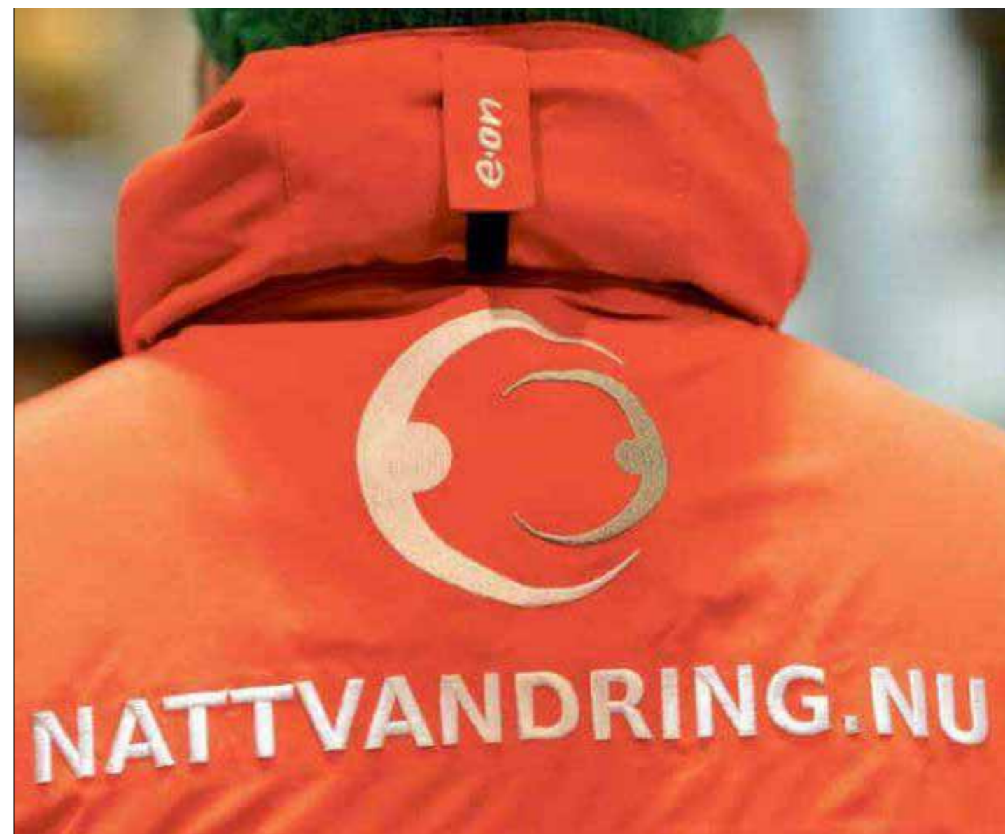
ENGAGEMANG. I tisdags hade nattvandrarerna i Ljungskile ett möte för att informera om hur och vad man ska tänka på under vandringarna.

Ansvarig utgivare: Stefan Johansson Tel: 0522-68 69 48 Adress: Ljungskile folkhögskola, 459 80 Ljungskile E-post: ln@ljungskile.org