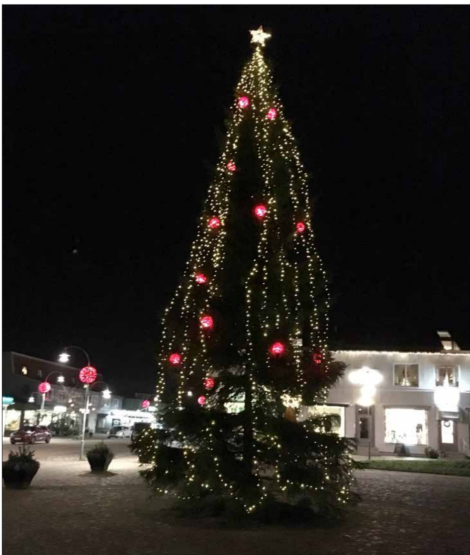
JULELJUS. Årets julgran är uppe i Ljungskile.

Försäljning av kärvar, glögg, pepparkakor, hembakat, miniloppis, hantverk med mera. Tomten delar ut godispåsar till barnen. Kören Fräknarna och folkdanslagets spelmän medverkar. 14 Ljungskileföreningar är på plats under dagen. Kl 12.00 koras Årets Ljushuvud i Ljungskile. Detta i samverkan mellan LSK som initiativtagare, samt i år Lions Ljungskile, Ljungskile Samhällsförening och Uddevalla Näringsliv i Ljungskile. Hemgården lördag 9/12 kl 10–13. Fri entré.