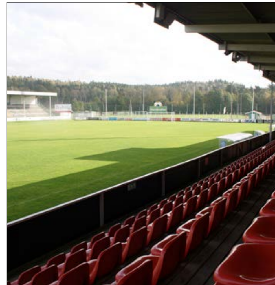
SVÅR SITUATION. LSK hoppas ta sig uppåt, men det krävs mer pengar.