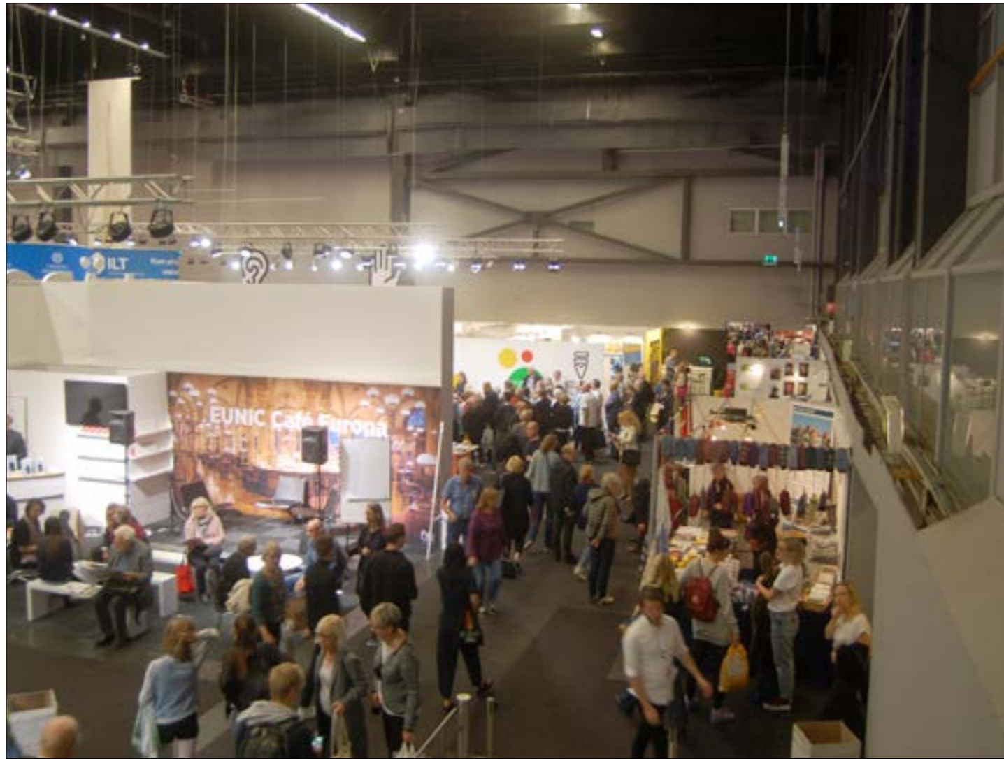
PUBLIK. Årets start av Bokmässan lockade en stor publik.