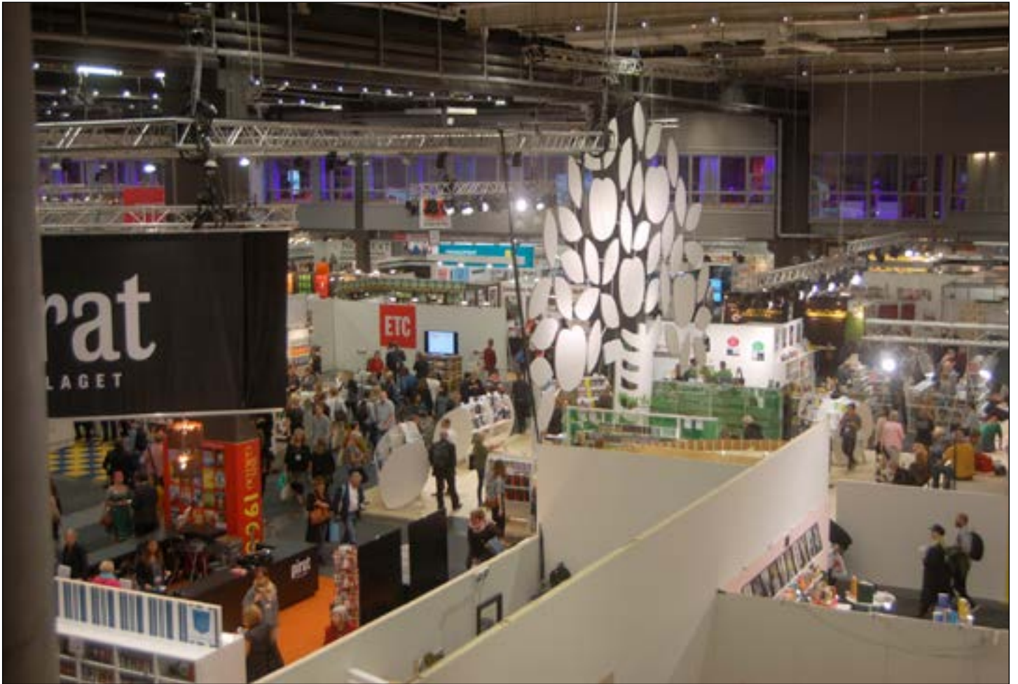
BOKMÄSSAN. Årets upplaga av Bokmässan har temat bildning.