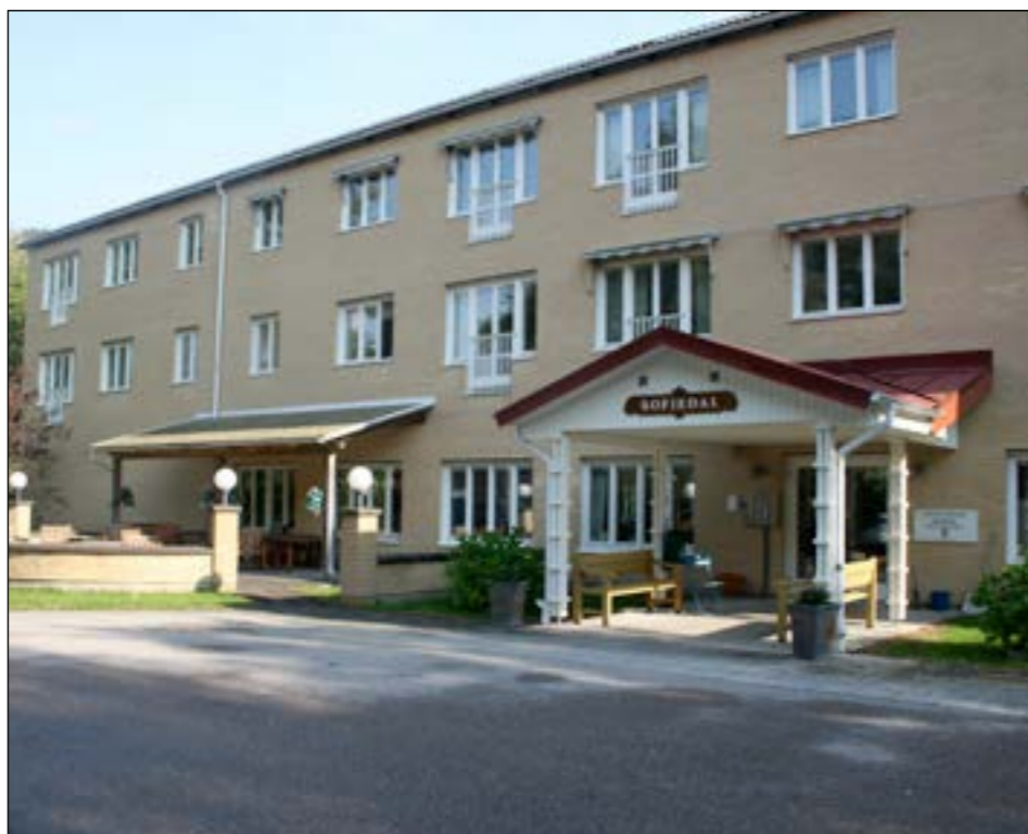
OMBYGGNATION. Sofiedal byggs om till ett trygghetsboende.

Något som vi också vill rätta är stavningen på området Ammenäs i Uddevalla kommun, som också stavades fel i föregående nummer av Ljungskile Nyheter.