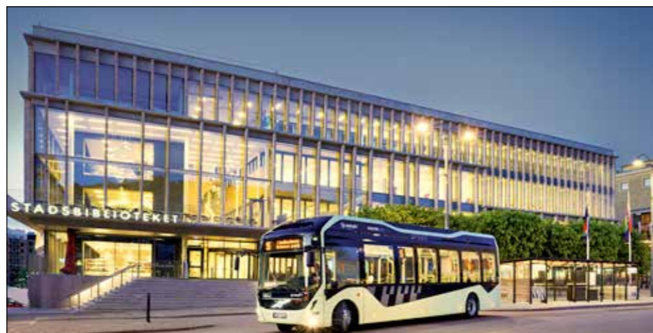
KOLLEKTIVTRAFIK. Många mil i bussfil.