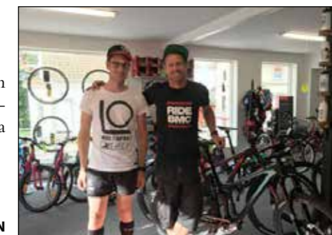
GLADA CYKELKILLAR.