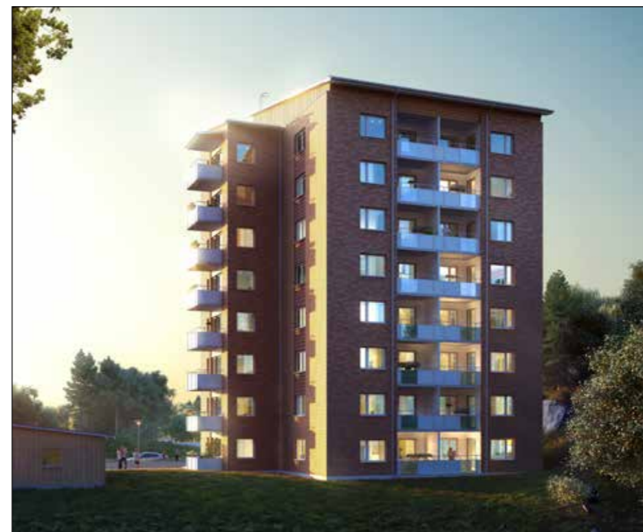
RUDAN. Så här förväntas Rudan se ut.